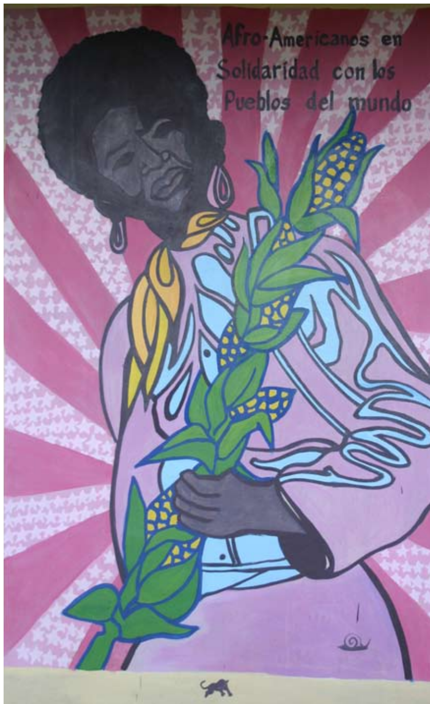
Imagen icónica de Pantera Negra artista Emory Douglas, recreado como un mural en territorio Zapatista, Chiapas, México.